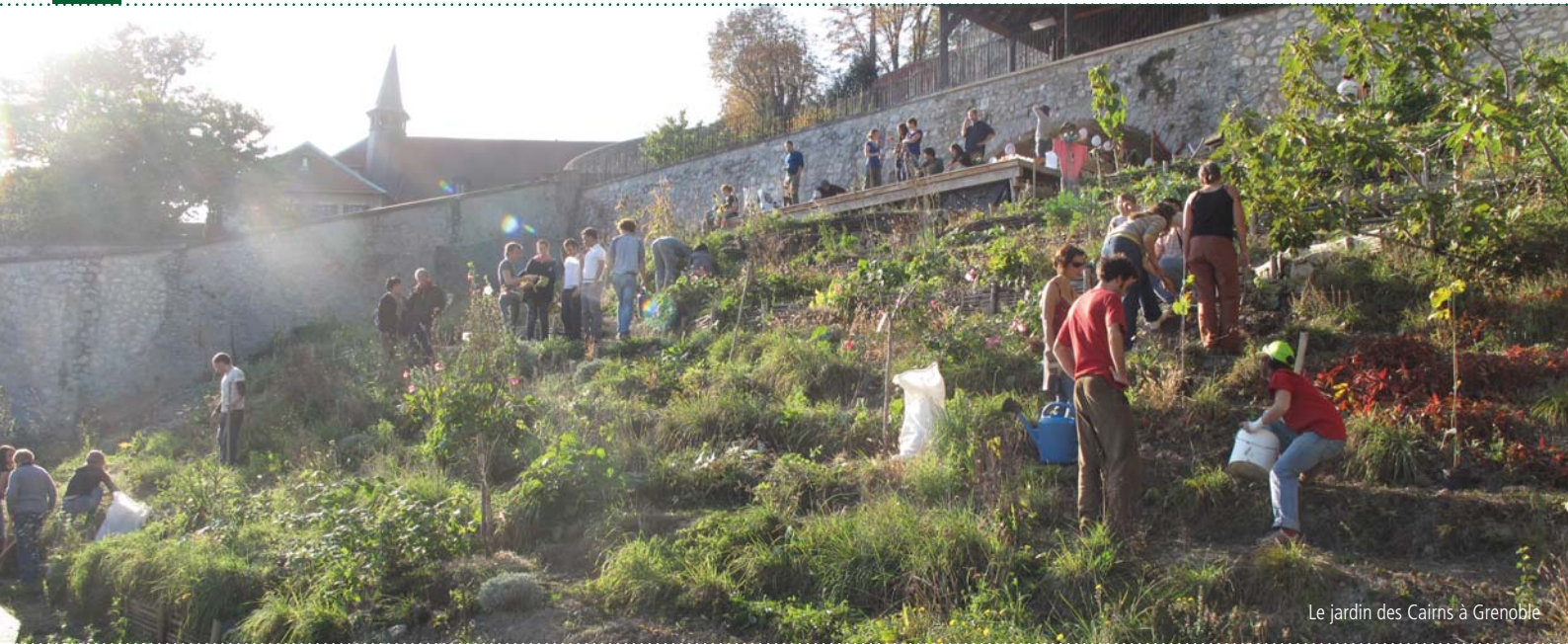
Le jardin des Cairns à Grenoble